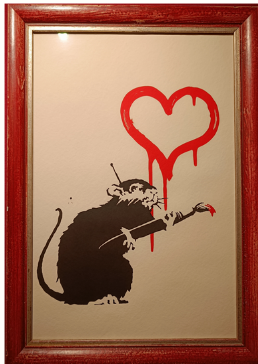
'Love Rat' By Banksy